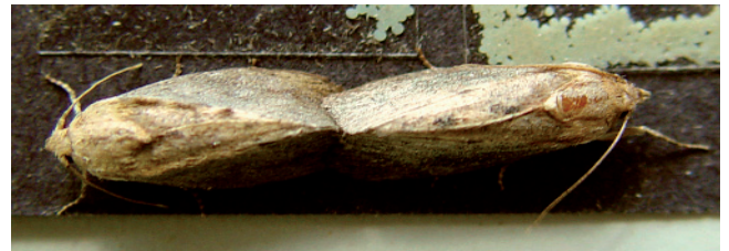
Copulation: femelle à droite et mâle à gauche

La femelle commence à pondre ses oeufs entre le 4ème et le 10ème jour après l'émergence du cocon [5]. C'est à la tombée de la nuit que la femelle cherche à pénétrer dans les ruches pour y pondre ses oeufs. Si la colonie est forte et qu'elle n'y parvient pas, elle dépose ses oeufs à l'extérieur dans les fentes du bois.